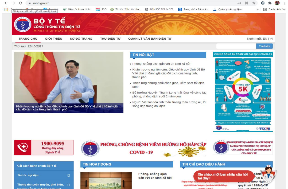
Trang thông tin điện tử của Bộ Y tế